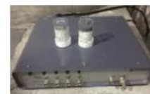
热线热膜风速仪&眼镜蛇风...